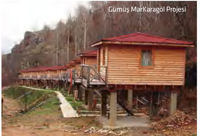
Gümüş MarKaragöl Projesi