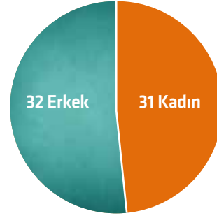
Şekil 2: DOKA Personelinin Cinsiyete Göre Dağılımı 2024